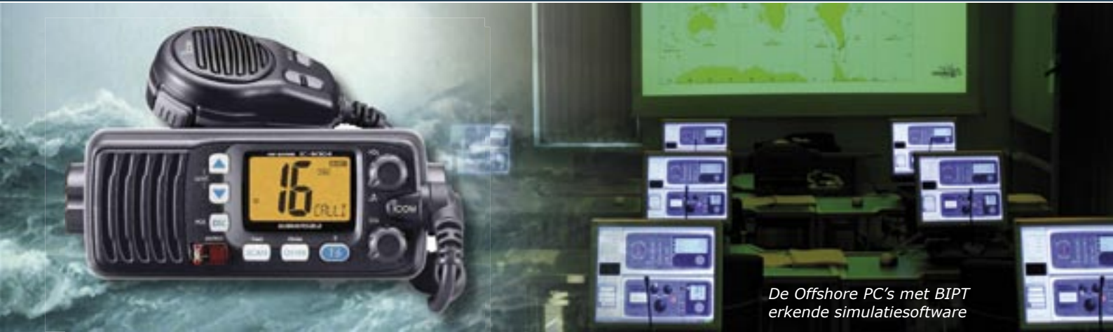
De Offshore PC's met BIPT erkende simulatiesoftware